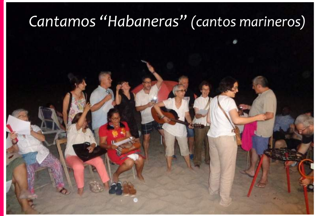
Cantamos "Habaneras" (cantos mariner)