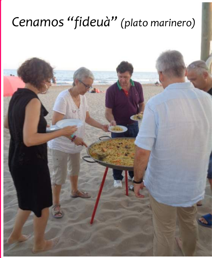
Cenamos "fideuà" (plato mariner)