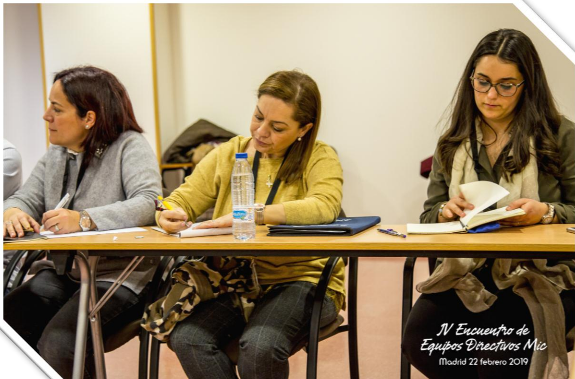
IV Encuentro de Equipos Directivos Mic Madrid 22 febrero 2019