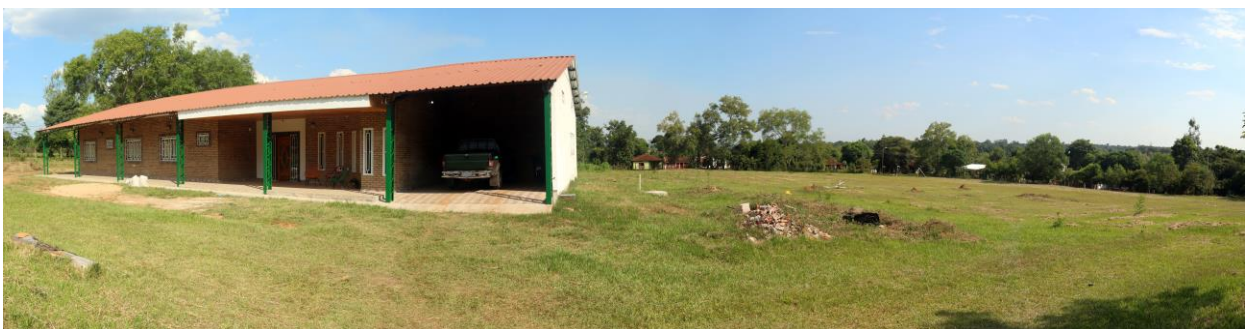
Nueva Comunidad MIC San Pedro