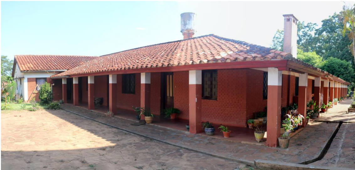
Antigua Comunidad MIC y futuro Centro Chantal

El grueso de la ayuda de la FSS en la localidad ha ido siempre enfocada a los niños, y este compromiso con la educación y desarrollo de los más jóvenes se ha visto reforzado con el apoyo que se está dando al proyecto “SANA AVENTURA”, que trata de paliar los efectos que sobre la población infantil y juvenil tiene la grave problemática nacional del consumo de alcohol y drogas, especialmente marihuana, paradigmática y crónica en el entorno sanpedrano.