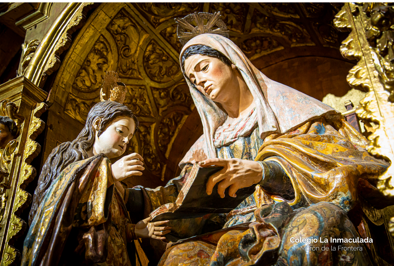
Colegio La Inmaculada Morón de la Frontera