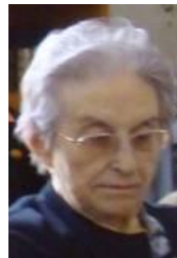
“Sólo Dios basta” (Santa Teresa)

* Écija, (Sevilla) 25/05/ 1925 +Bonanova, (Barcelona) 11/05/ 2011