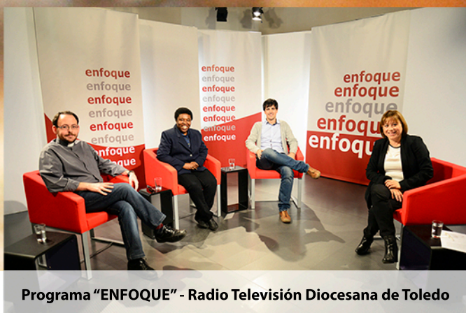
Programa "ENFOQUE" - Radio Televisión Diocesana de Toledo