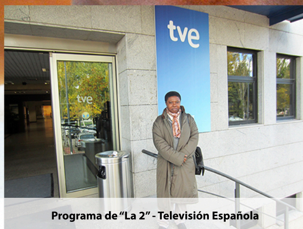
Programa de "La 2" - Televisión Española