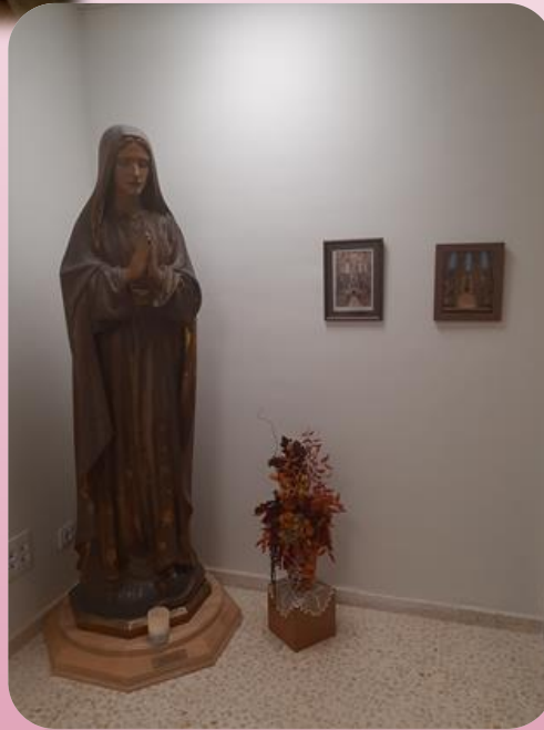
Sala Inmaculada Concepción