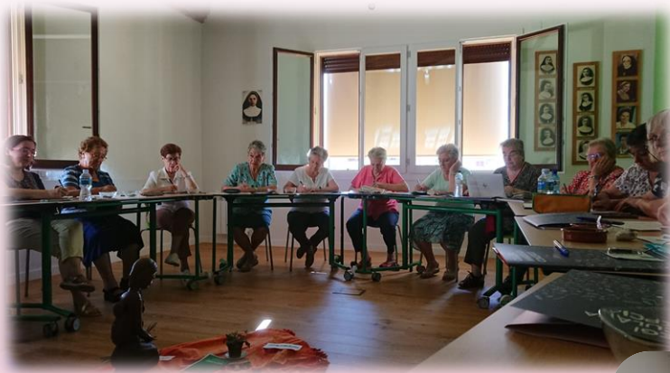
Sala Alfonsa Cavin