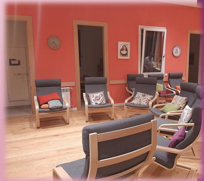
Sala de comunidad