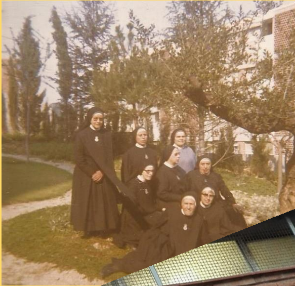
De esta imatge

Querem agrair en nom propi i de la Congregacio religiosa a la que pertanecem com Misioneres de la Inmaculada Concepcio el honor que nos heu fet de compartir amb vosaltres un llarg recorregut i la sollicitud de fer el Pregon de les Fiestas amb motiu de els 52 anys de nostra presencia en Ciutat Meridiana.