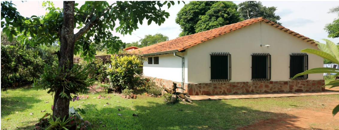
Comunidad MIC San Francisco

La primera parada de la visita fue la Comunidad MIC de San Francisco, una compañía del distrito de Santa Rosa, en el Departamento de Misiones, que ejerce de contraparte local de los proyectos que en esta zona la FSS lleva apoyando varios años, incluso desde la época del FAC, principalmente relacionados con el acompañamiento de familias rurales y con la promoción de mujeres y niños/as en situación de desigualdad y/o violencia.