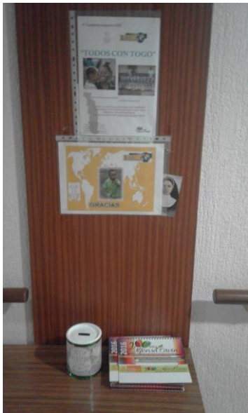
Carteles y hucha en Pozuelo