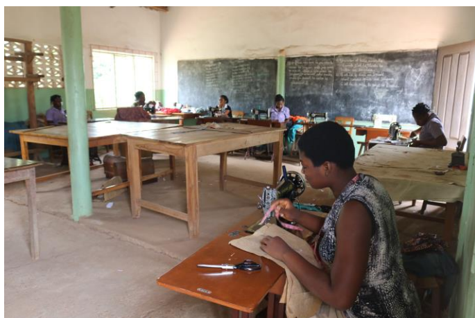
Taller de costura en la Escuela Menagere