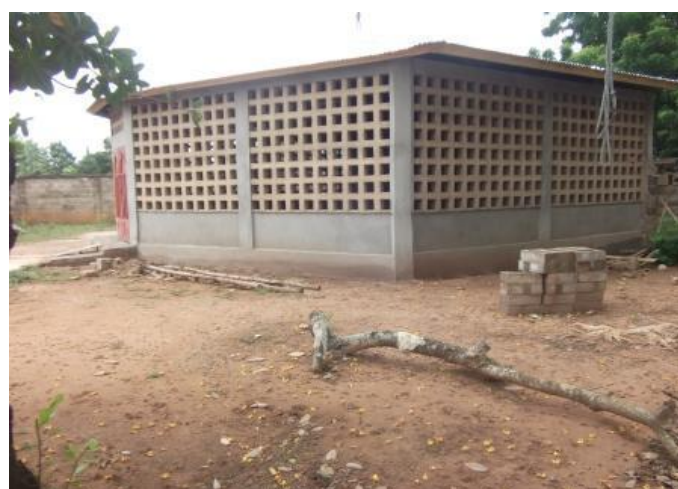
Estado de las obras en el parvulario (sep 2016)