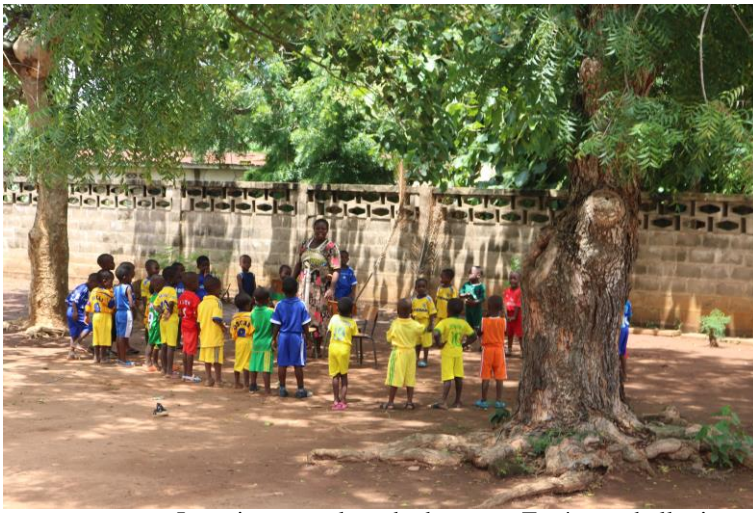
Los niños, en clase de deportes. En época de lluvias o mucho sol, no pueden jugar