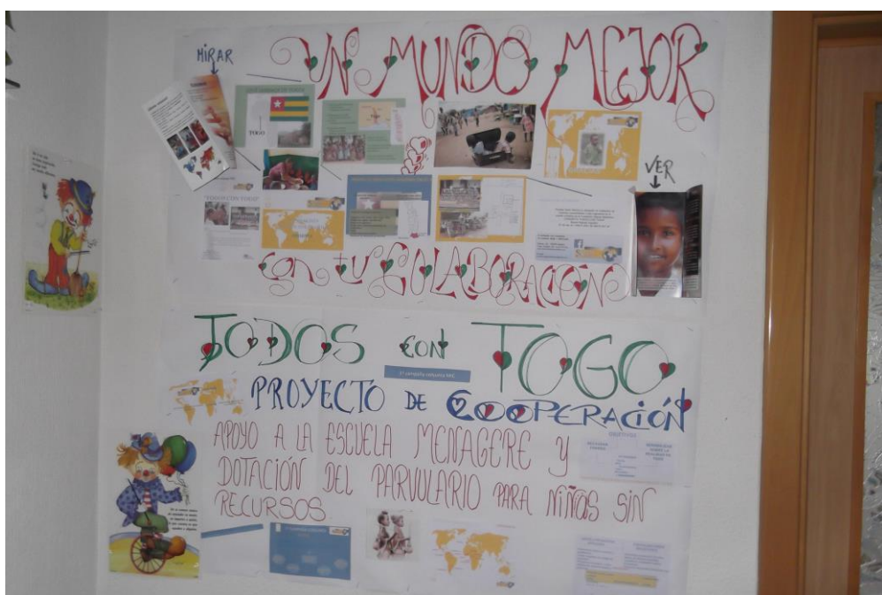
Carteles de publicidad en la Residencia de Fermoselle