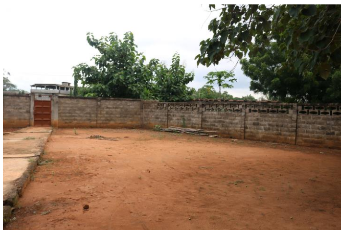
Lugar de construcción del pailotte