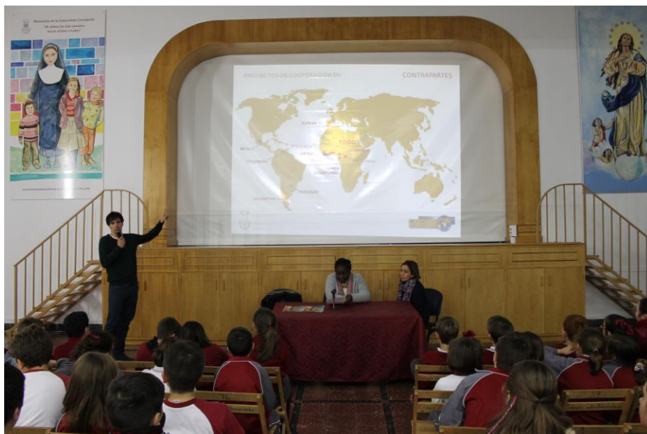
Sensibilización semana Misionera en Morón de la Frontera

Así, ya implicaran la recaudación de dinero o no, se llevaron a cabo durante todo el año diferentes actividades encaminadas tanto a la presentación del proyecto como a la difusión de la problemática togolesa, particularmente la educativa, y el acercamiento de la labor que las MIC y la FSS realizan en este país, los problemas de los beneficiarios del proyecto así como su realidad cultural, tanto a nuestra base social dentro de la congregación como a todo aquel interesado en ello.