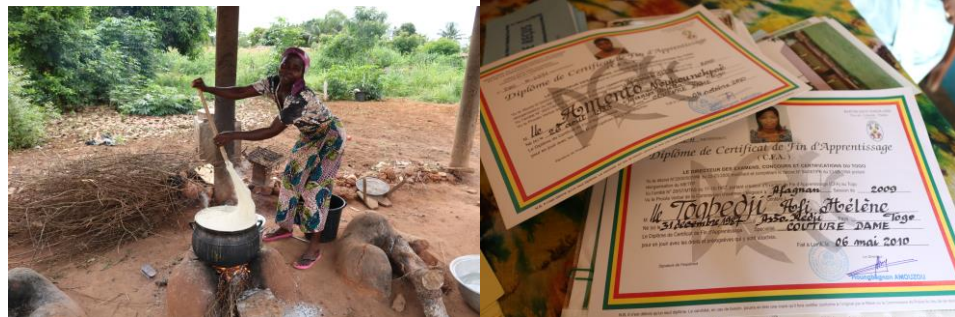
Imágenes Escuela Menagère