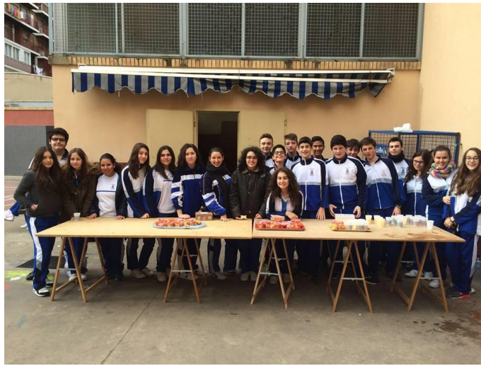
Pincho solidario en Zaragoza