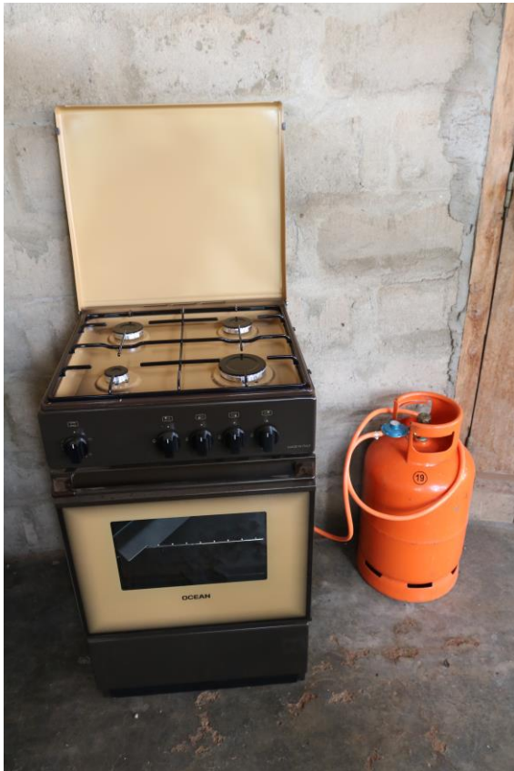
Material curso cocina escuela formación femenina