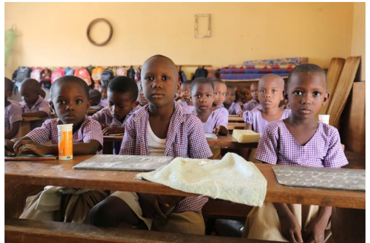
Párvulos en clase