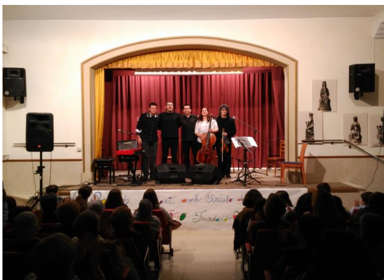
Concierto solidario grupo “Círculo de Borneo”, organizado por el colegio Mare de Déu del Socós, en Agramunt

Como ya se ha mencionado, son muchas y muy diversas las actividades y el tiempo dedicado de un modo u otro a concienciar sobre la realidad de Togo, la campaña y la obtención de recursos para el proyecto, en diferentes lugares. Desde el trabajo diario en la aulas, como en el col.egi Immaculada Concepció de Barcelona, hasta la venta de mobiliario, en México, pasando por la cuelga de carteles en Algeciras, la realización de actividades con los mayores en las Residencias MIC, la concesión de entrevistas y la publicidad en algunos medios de comunicación y RR.SS., el gran trabajo de nuestra delegadas en Navarra, La Rioja, Cataluña, Castilla y Andalucía o la realización de numerosos mercadillos solidarios. Agradecemos todas y cada una de las iniciativas y el trabajo de tantas personas, que sería imposible resumir aquí.