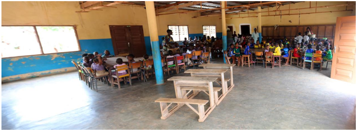
Comedor del Parvulario Matilde Pascual