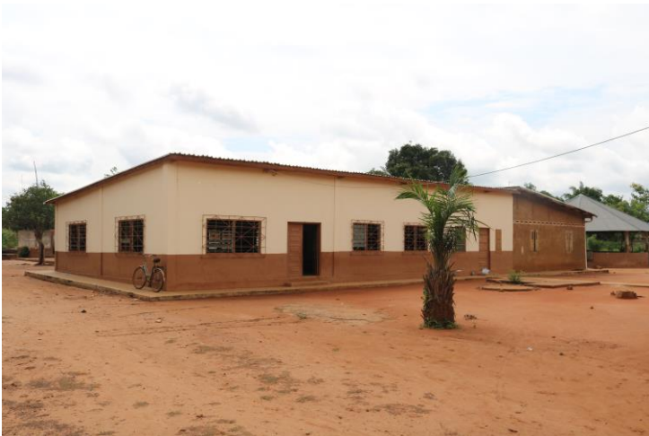
Instalaciones del Parvulario

En el mes de mayo, FSS visitó la población de Afagnan Gbletá para, además de hacer entrega de la recaudación de la campaña (logrados los objetivos económicos), transmitir el trabajo de los últimos meses a favor del proyecto a los beneficiarios del mismo, seguir el estado de la ejecución de la primera parte del proyecto (Escuela Menagére) y comprobar la pertinencia del apoyo al parvulario M. Matilde Pascual.