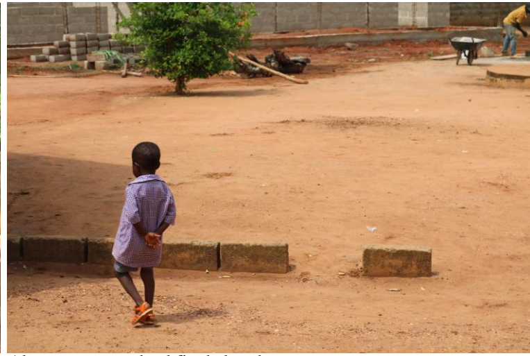
Alumno, esperando el fin de las obras