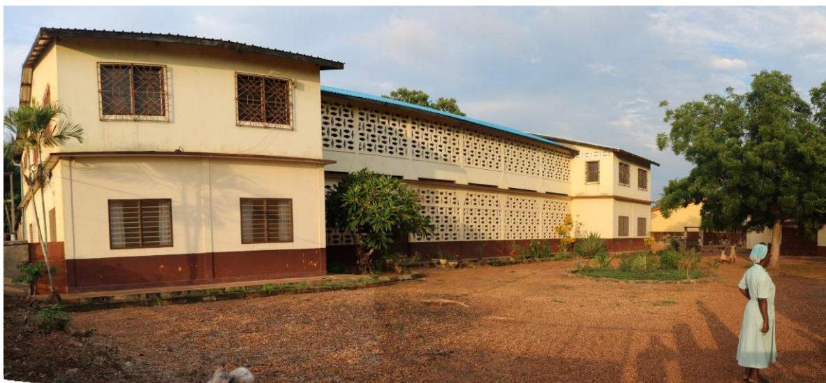
La Comunidad MIC de Afagnan Gblétá

A partir de aquí, diversas actividades comunes: venta de papeletas para la rifa de una tv, calendario solidario, etc, se combinaron con aquellas surgidas de la iniciativa local, como conciertos o teatros, en la parte recaudatoria, y con las sesiones de sensibilización de diversa índole realizadas.