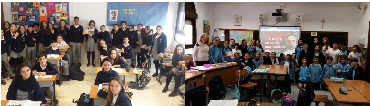
6ºA de primaria y 1ºA de secundaria del colegio La Inmaculada de Ceuta, ganadores del concurso de venta de calendarios