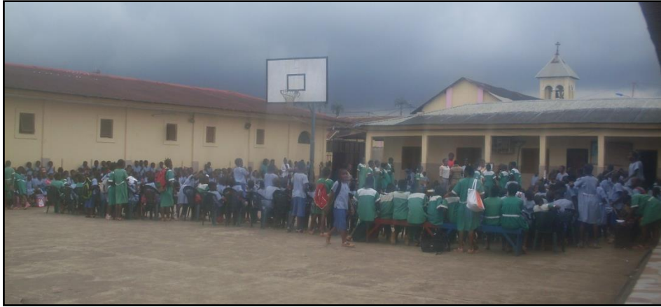
Inauguración del acto (himno)

Tras cantar el himno, los alumnos fueron tomando asiento y se organizaron por cursos para facilitar las salidas al escenario y las actividades previstas.