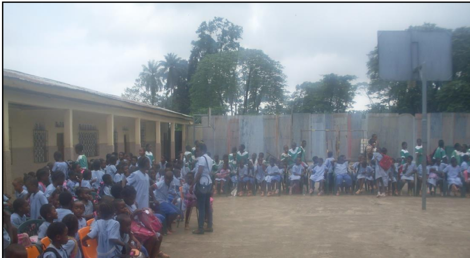
Inauguración del acto (himno)

Bajo estas líneas se adjuntan una serie de fotografías que recogen el momento inicial del acto donde los alumnos cantan al unísono el himno: “ pasión misionera ”.