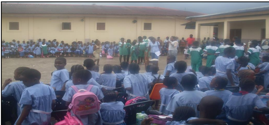
Alumnos de 6° de primaria

El concurso de preguntas se realizó con los alumnos de sexto de primaria. Se organizaron en dos grupos, uno de chicas y otro de chicos. Se les formuló varias preguntas relativas a la Madre Alfonsa, tales como ¿En qué localidad de Barcelona fue destinada la Madre Alfonsa? o ¿En qué año nació la Madre Alfonsa? Tras finalizarse el turno de preguntas se realizó un recuento de votos y ganó el grupo de los chicos; no obstante, para evitar agravios comparativos se decidió compartir los premios en ambos grupos.