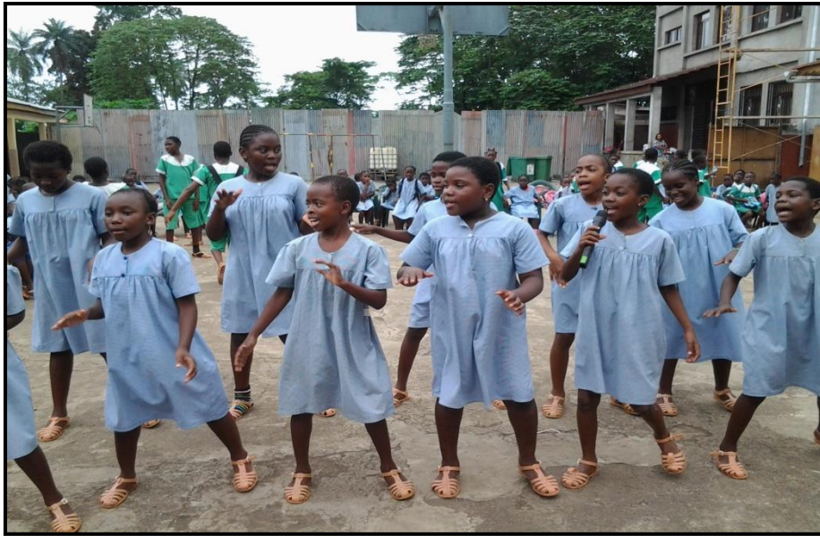
Actuación grupal. Chicos de cuarto.

Tras la actuación de los chicos de 4° de primaria intervinieron los de 5° de primaria, también nos deleitaron con una canción y varios recitales de poesía.