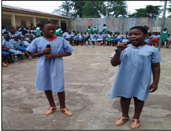
Recital de poesías en parejas