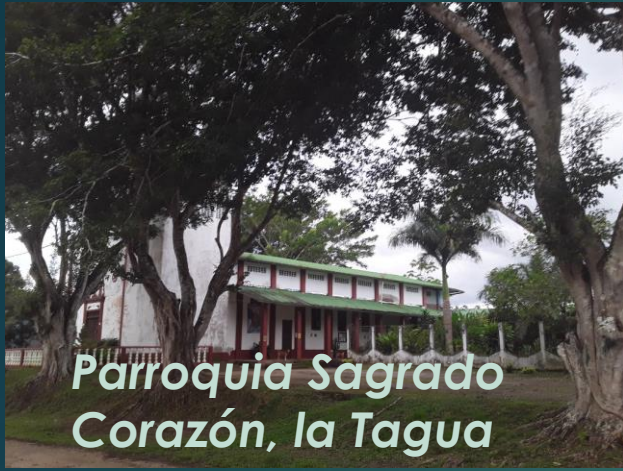
Parroquia Sagrado Corazón, la Tagua