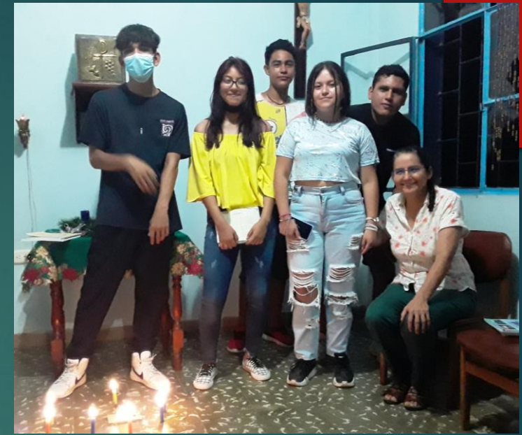
Pastoral juvenil: Jóvenes cuidadores de la creación

CAMINAR Y ANUNCIAR EL REINADO DE JESÚS DE NAZARET EN LOS DIVERSOS GRUPOS HUMANOS DE LA PARROQUIA DE LA TAGUA COMO IGLESIA POBREY MISIONERA