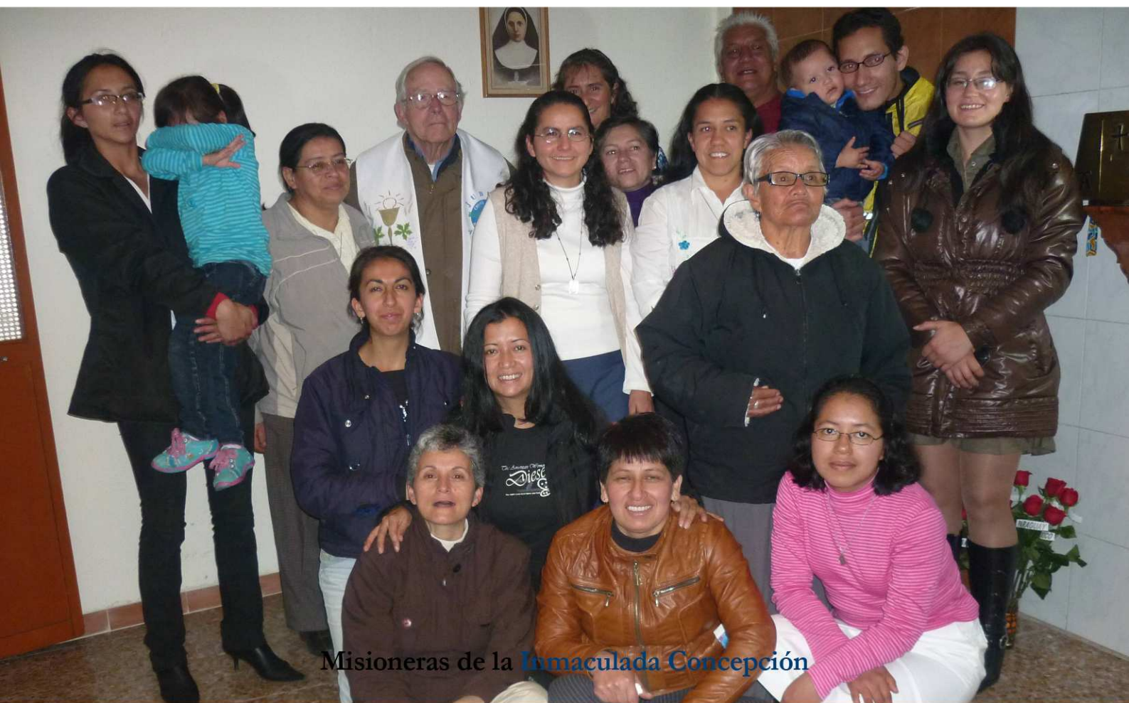
Misioneras de la Inmaculada Concepción