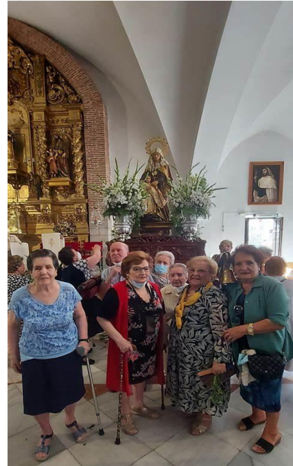
VISITA CULTURAL A LA PARROQUIA