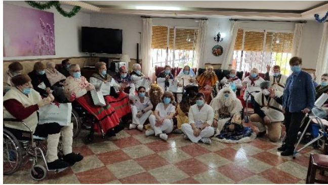
ENCUENTROS Y CELEBRACIONES