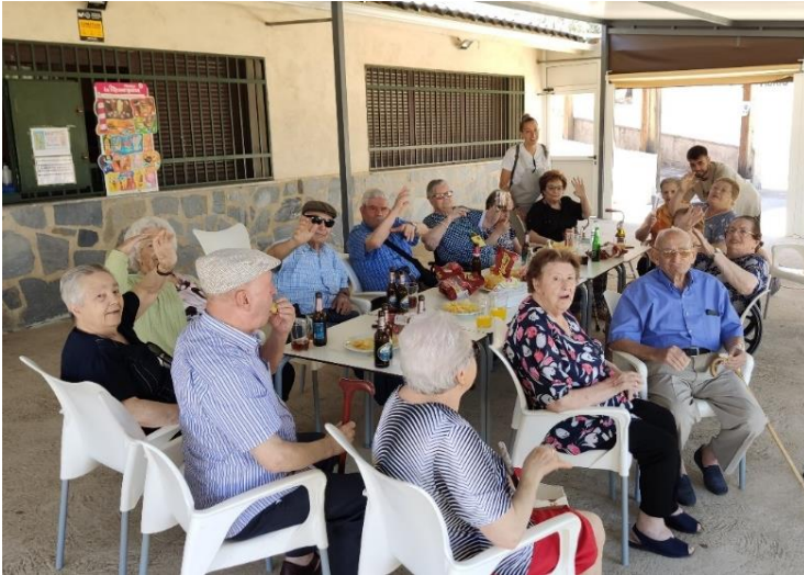
VISITA CULTURAL Y RECREATIVA AL PANTANO