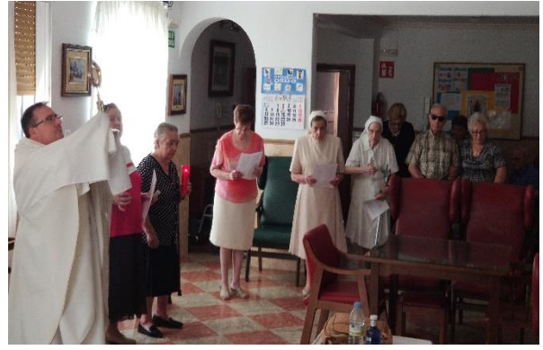
DÍA DEL CORPUS, BENDICIENDO A TODOS LOS RESIDENTES Y LUGARES DE LA CASA.