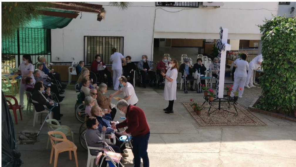
CELEBRACIÓN DEL DÍA DE LA CRUZ